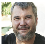
Helmut Leser Rezensionen

Porträt-Fotos © Emmerich Mädl Michaela Moser Porträt-Foto © Charlotte Titz Programmänderungen vorbehalten